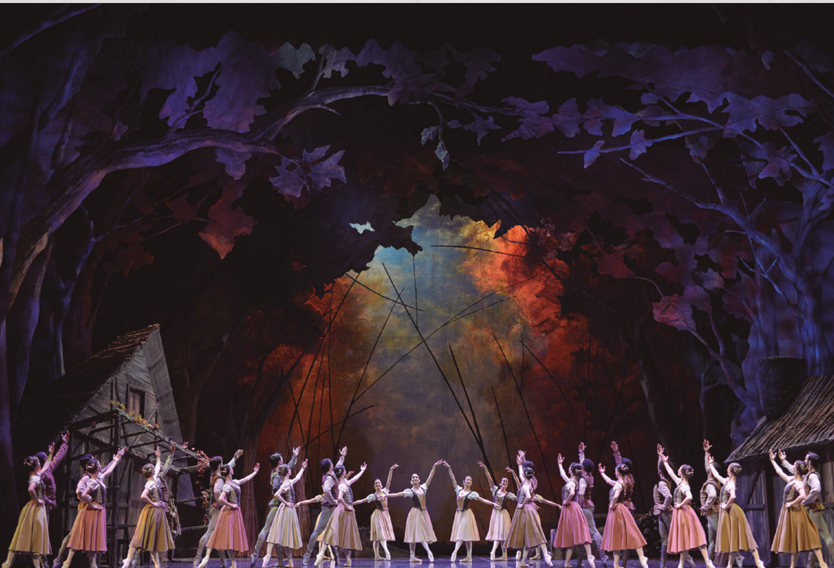
Giselle 2015.