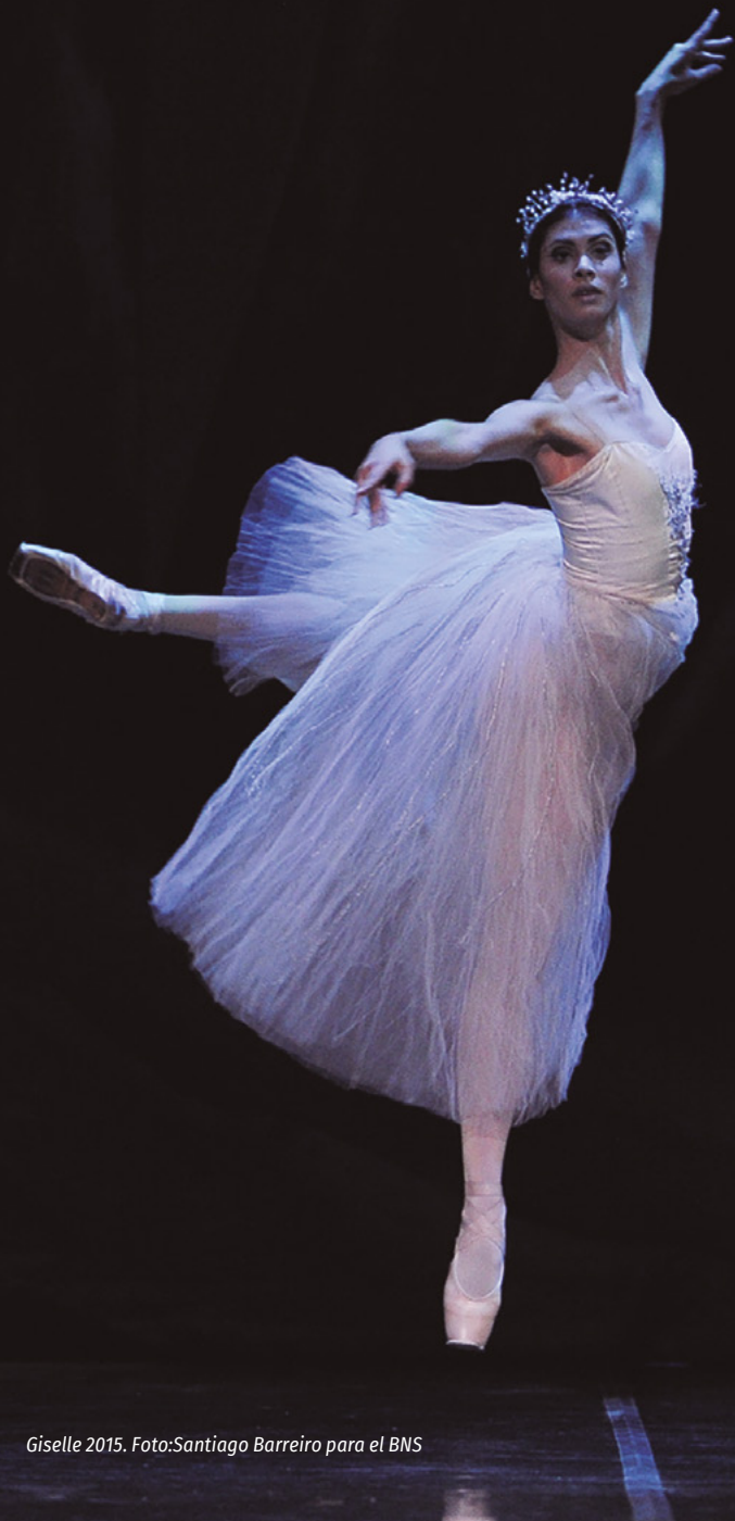
Giselle 2015.